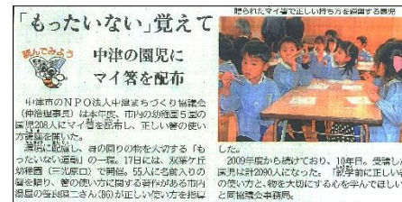
大分合同新聞 朝刊 平成31年1月19日(土)