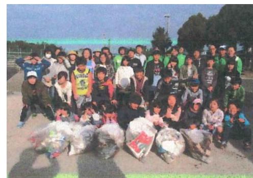
和田小学校父親部会