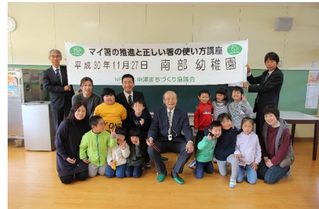
園児達と記念撮影

「もったいない運動」の一環と環境への配慮を目的に、マイ箸の推進とお箸の文化の継承を行った。お箸には、園児の名前ともったいない運動推進キャラクター「もったいない鳥」とマイ箸事業10周年を記念し「10」の文字を箸に刻印。市内の私立幼稚園（めぐみ幼稚園、東九州短期大学附属幼稚園、双葉ヶ丘幼稚園）と公立幼稚園（和田幼稚園、南部幼稚園）の計5園、年長組園児209名に実施。