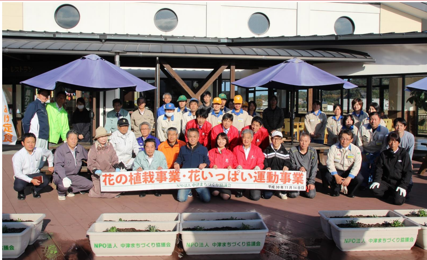
写真／花の植栽・花いっぱい運動