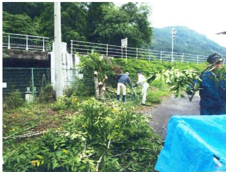
耶馬溪町下郷地域等安全安心活動隊

町内会や子ども会、個人などを対象に、地域貢献やまちづくり活動を行っている人に対し、年1回の申請に限り1万円を助成し支援を行った。