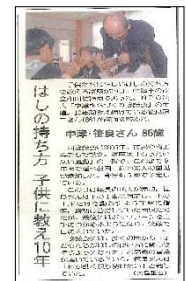
朝日新聞 朝刊 平成30年11月20日(火)